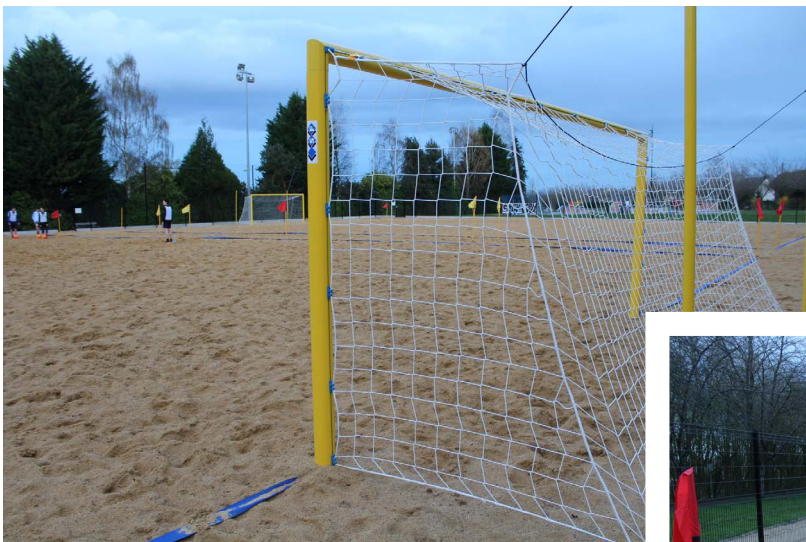
BRETAGNE, LE RHEU