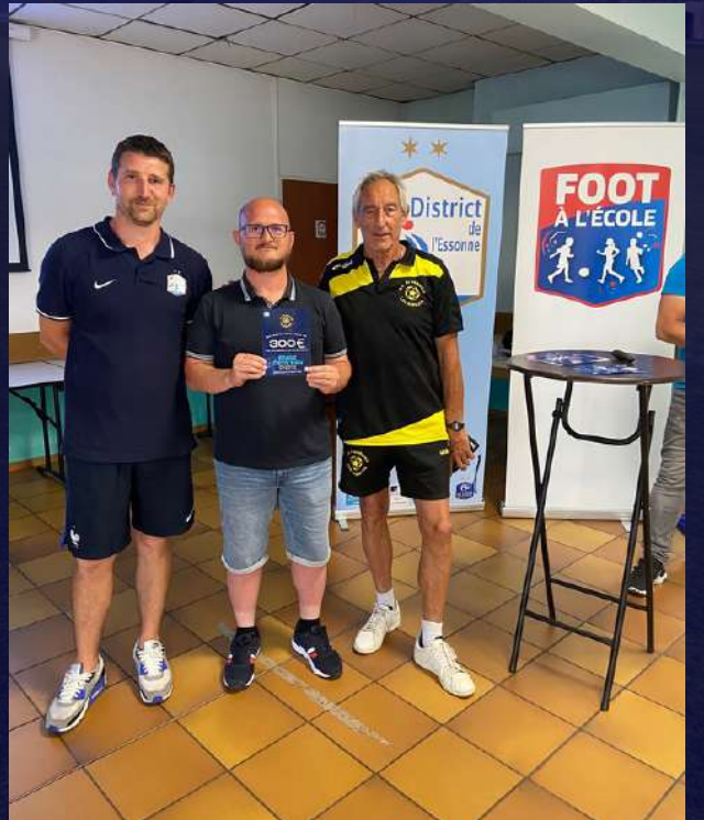
AS St Germain les Arpajons