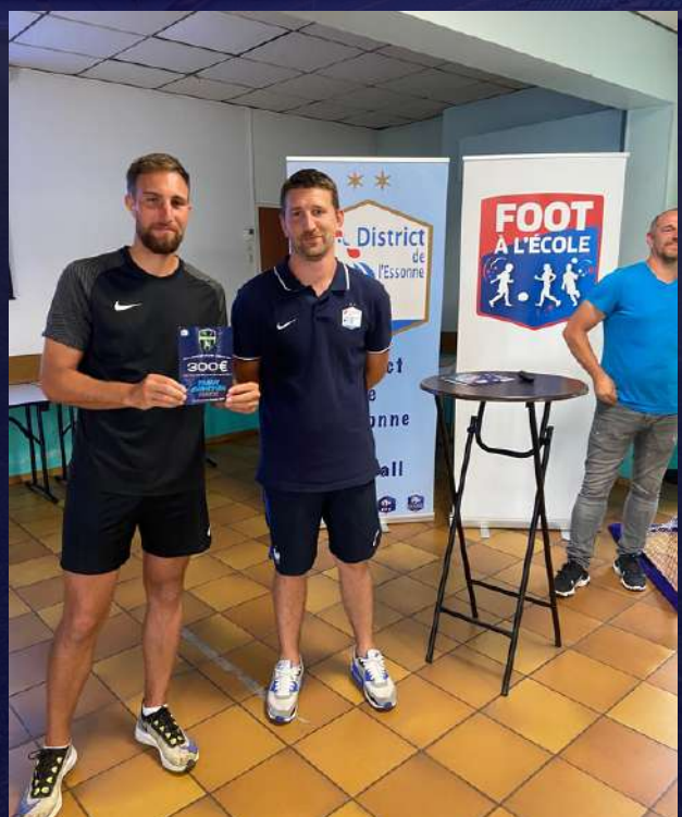
FC Milly Gatinais