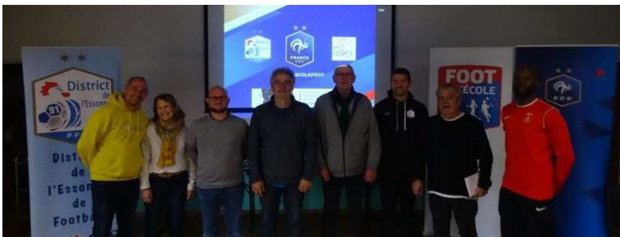
Jury départemental Scolafoot, saison 2022-2023